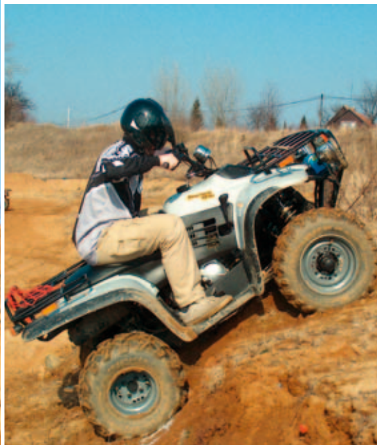
nahoře Velká světlá výška umožňuje překonání velkých nerovností