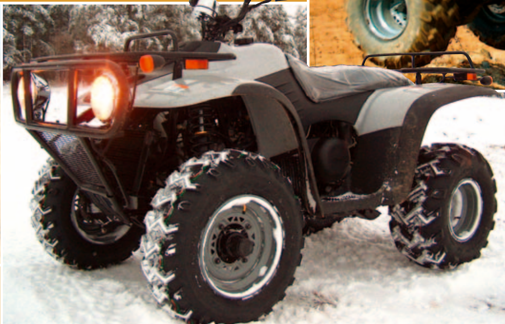
nahoře JourneyMan si nechá líbit i jízdu po bočních kolech

V okamžiku, kdy jsme tento stroj poprvé uviděli, jsme si pomysleli, že si z nás dovozce dělá legraci, protože před námi stála čtyřkolka Polaris. Až při podrobnějším zkoumání jsme zjistili, že to opravdu není Polaris. JourneyMan je totiž téměř do detailu okopírovaným modelem Magnum 325! Oba stroje se shodují natolik, že mnoho klíčových dílů podvozku včetně rámu lze vzájemně zaměnit.