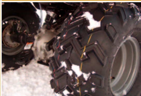
vpravo Výborné pneumatiky ihned zaujmou